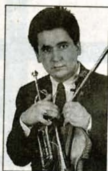
Nuance Jazz Trio